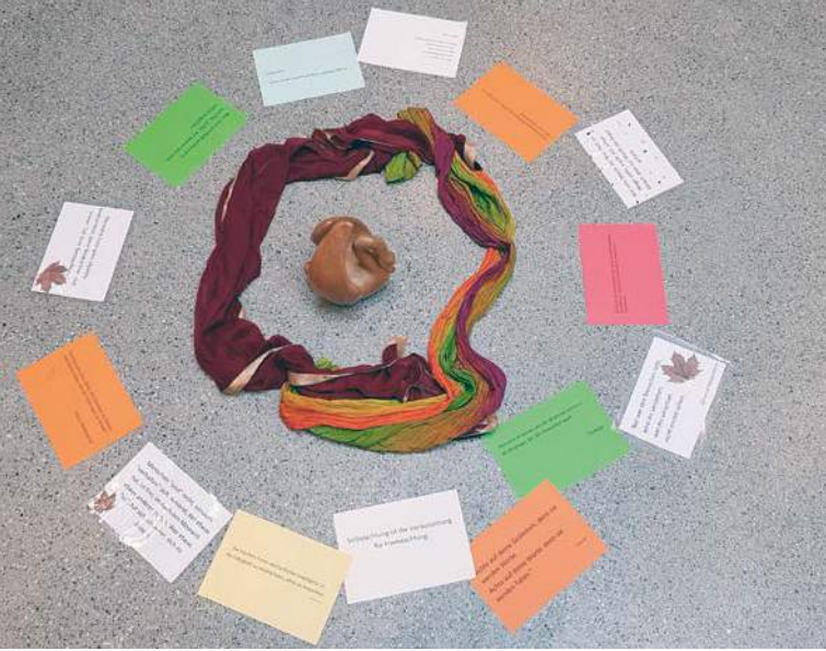
Der Kreis als Symbol des Konsenses

Lösungen, die in Dynamic Facilitation Sessions entstehen.“ Zurück zu den Flipcharts: Auf dem vierten Board stehen dann schlussendlich die Lösungen. Da alles Gesagte detailliert niedergeschrieben wurde, sollte sich jede*r Teilnehmer*in darauf wiederfinden. Das Ziel ist es, dass der Prozess stets in einer Konsenslösung endet.